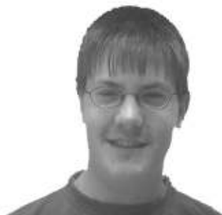
Stefan Ziltener Kamera

Regie: Hansueli Züger Conférencier: Martin Reichmuth Reservationen: Silvia Züger sen. Wettbewerb: Vreni Ziltener Inserate: Rita Heiz Programmgestaltung: Silvia Züger jun.